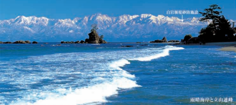
雨晴海岸と立山連峰