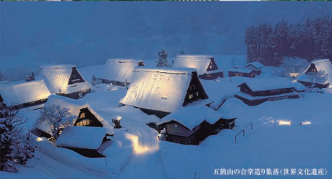
五箇山の合掌造り集落(世界文化遺産)

2012年7月29日(日) 13:30~16:45 開場 13:00 砂防会館 別館シェンバツハ・サポー 東京都千代田区平河町2-7-5