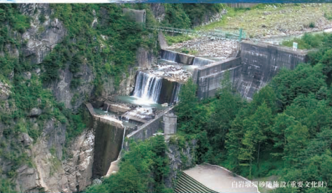
白岩堰砂防施設(重要文化財)